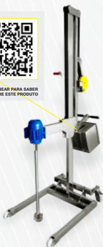
DISPERSOR DE COLUNA MÓVEL