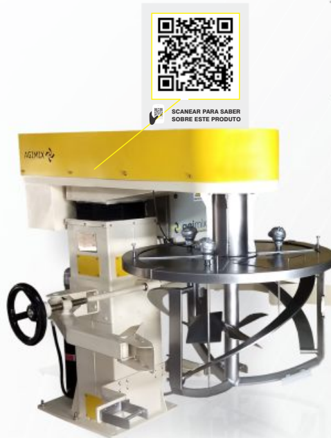
MISTURADOR DE COLUNA HIDRÁULICA