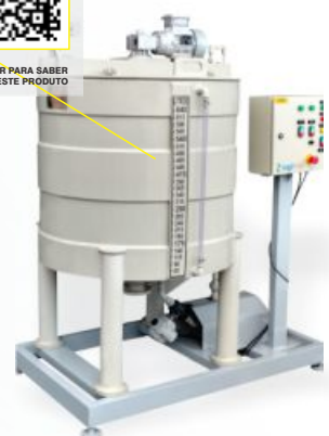
SKID DE PROCESSO