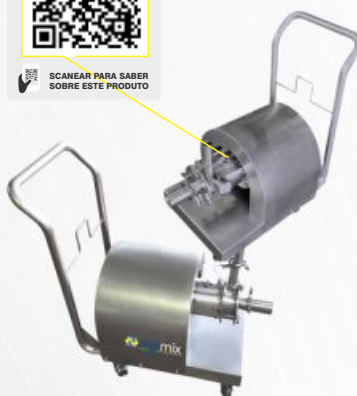
BOMBA HIGH SHEAR