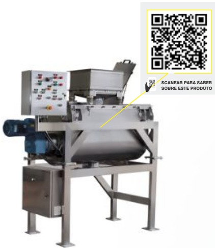
MISTURADOR RIBBON BLENDER