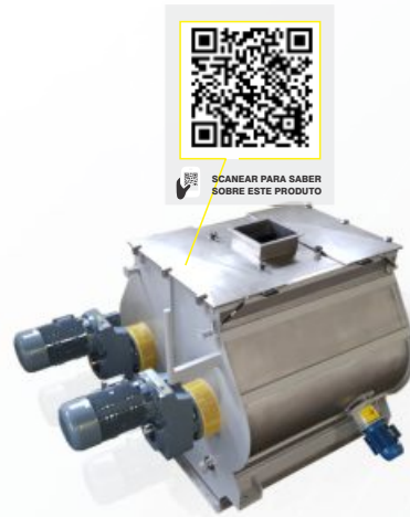
MISTURADOR ZONA FLUIDIZADA (DUPLO-EIXO)