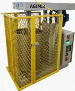
AGITADOR DE BANCADA