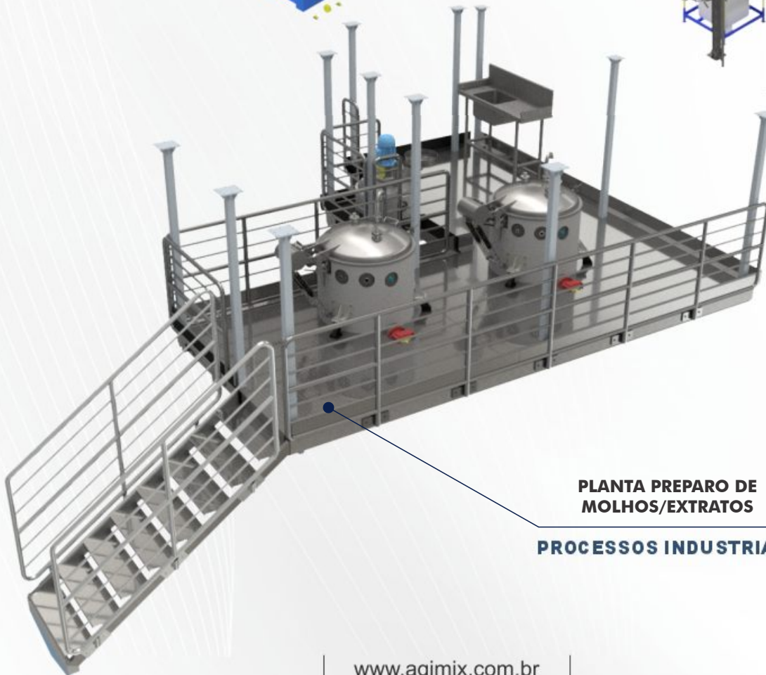
PLANTA PREPARO DE MOLHOS/EXTRATOS