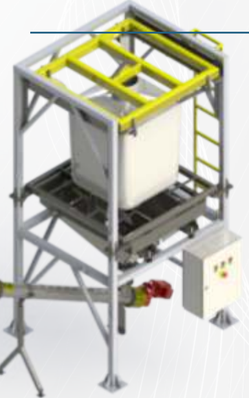
Sistema completo de mistura e alimentação por BAG

Nossos sistemas de alimentação automatizados pode contar ainda com sistema preciso de dosagem e verificação de peso por célula carga, podendo ser montado ainda com um ou mais descarregadores de BAG.