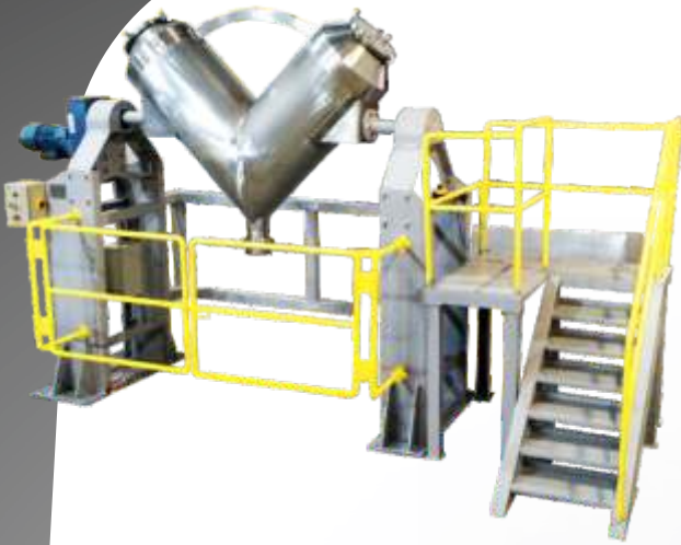
Misturador completo com plataforma de acesso para alimentação

Os misturadores V/Y Agimix podem ser fornecidos com plataforma de acesso e alimentação de acordo com a necessidade do cliente. Segue as normas de segurança NR-12 e podem ser projetadas para complementar a estrutura existente ou planejando uma nova estrutura completa.